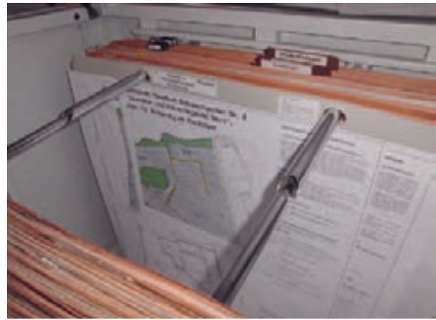
Bauleitplanung: Aufbewahrung von Bebauungsplänen

gehen wir gegenwärtig von einer Archivierungsquote von etwa 20 Prozent aus. – Für die Kartensammlung hat dies im Übrigen keine Auswirkungen, da nicht vorgesehen ist, die gefalteten Pläne aus den Akten zu entnehmen. Allerdings sind in der Vergangenheit auch zahlreiche Baupläne ins Kreisarchiv gelangt, deren Herkunft nicht mehr zu rekonstruieren ist. – Selbstverständlich finden sich in der Kartensammlung des Stadtarchivs ebenfalls zahlreiche Baupläne, und zwar gelegentlich über die heutigen Stadtgrenzen hinaus.