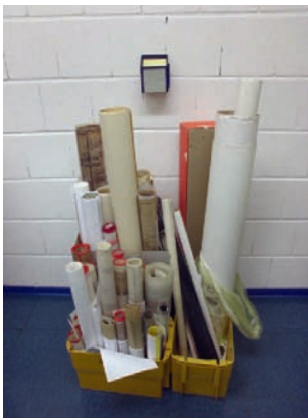
Baustellen: Die Kartensammlungen im Stadt- und Kreisarchiv Paderborn