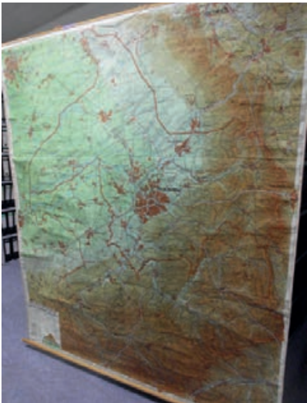
Sperrig: Schulwandkarten

Natürlich gilt es, nicht nur auf die Verwaltung zu schauen, sondern selbst aktiv zu sammeln. Das gilt zunächst einmal für Handelsware, gedruckte Stadtpläne, Fahrpläne oder (Rad-)Wanderkarten, das gilt weiter für Atlanten (z. B. Westfälischer Städteatlas oder Flurnamenatlas), das gilt aber auch für Reproduktionen historischer Karten oder für Kartenmaterial zu speziellen Themen, sei es zur Geologie, zur Hydrologie oder zum Klima. Darüber hinaus tauchen auch im Antiquariatshandel oder bei Internetauktionen Karten und Pläne auf. Manchmal gelingt es sogar, „verirrtes Archivgut wieder einzufangen“, 19 wie Heinrich Otto Meisner so schön formuliert hat.