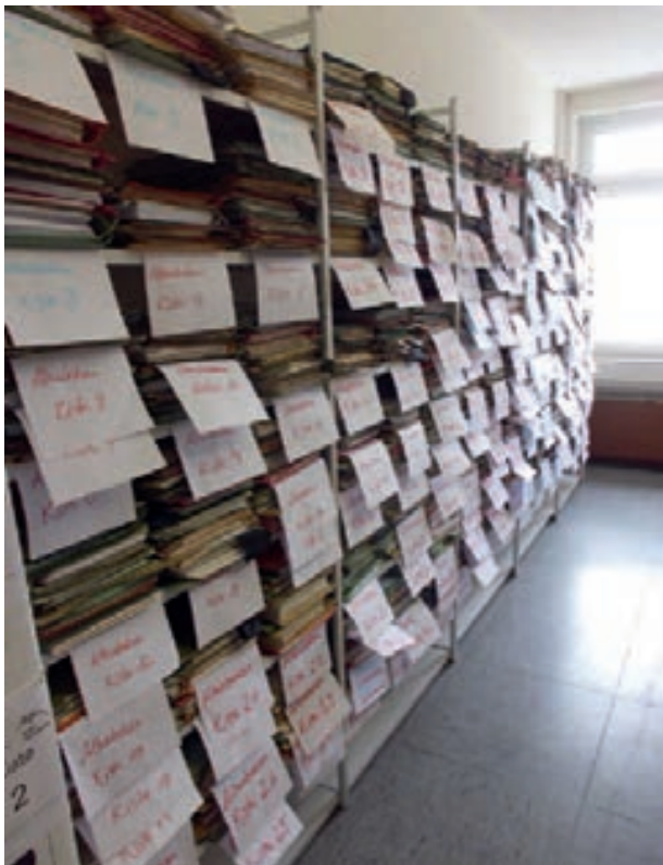
Totalarchivierung unmöglich: Übernahme von Bauakten

Beim Kreis Paderborn wurden noch bis vor kurzem keine Akten an das Archiv abgegeben, allerdings auch keine entsorgt. Vor wenigen Monaten hat das Kreisbauamt mit der Digitalisierung der Bauakten begonnen. Das Kreisarchiv wurde in das Procedere einbezogen; für die Sichtung und Bewertung der Akten wurde sogar eine zeitlich befristete Stelle geschaffen. Über die Wertigkeit der Bauaktenüberlieferung ist ja in jüngster Zeit häufiger geschrieben und gesprochen worden. 17 Da der Gesamtumfang 1.800 lfd. m beträgt, kam eine Totalarchivierung der gesamten Kreisbauregistratur für uns allerdings von Anfang an nicht in Betracht. Nach der Erstellung eines Bewertungskonzepts