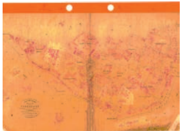
Nadelstichkopien: Auch bei Städten und Gemeinden gibt es zahlreiche Katasterkarten.

An zweiter Stelle folgen die Bau- bzw. Bauaufsichtsämter, bei denen ebenfalls große Mengen von Plänen und Zeichnungen unterschiedlichster Art anfallen. Bauaufsichtsbehörden gibt es in Nordrhein-Westfalen in der Regel in Kommunen ab etwa 25.000 Einwohnern. Für Städte und Gemeinden unterhalb dieser Begrenzung nimmt der Kreis