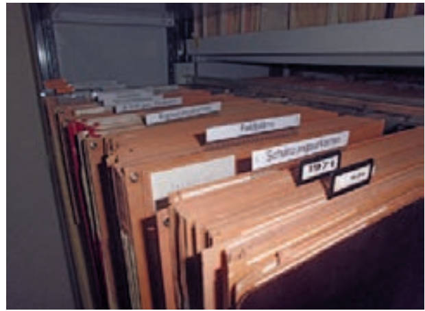
Größter Kartenproduzent: Das Katasteramt des Kreises Paderborn

als „ein geradezu aussichtsloses Unterfangen, auch nur annähernd dieses Spektrum archiverischer Karten zusammenfassen zu wollen. Je nach Region bzw. Archivsprengel, nach Geschichte und Dokumentationsprofil eines Archivs sind ... unterschiedliche und spezifische Kartenbestände überliefert.“ 15 Gleichwohl soll im Folgenden für die Stadt- und Kreisverwaltungen Paderborn ein Überblick versucht werden.