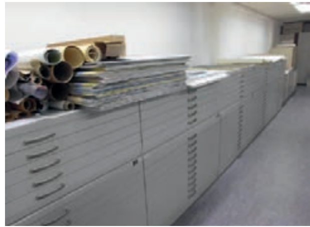
Liegende Lagerung: Kartenschränke der Abteilung Kreisarchiv

denes Archivgut in bunter Mischung. 14 Die strenge archivterminologische Unterscheidung zwischen Kartensammlungen und archivischen Kartenbeständen, zwischen Karten als Sammlungsgut und als Archivgut ist nicht nur schwierig zu realisieren, sie ist schon aus dem Grunde wenig sinnvoll, da Provenienzbezüge auf dem Weg ins Archiv vielfach verloren gegangen sind und sich auch nicht mehr, jedenfalls nicht genau rekonstruieren lassen.