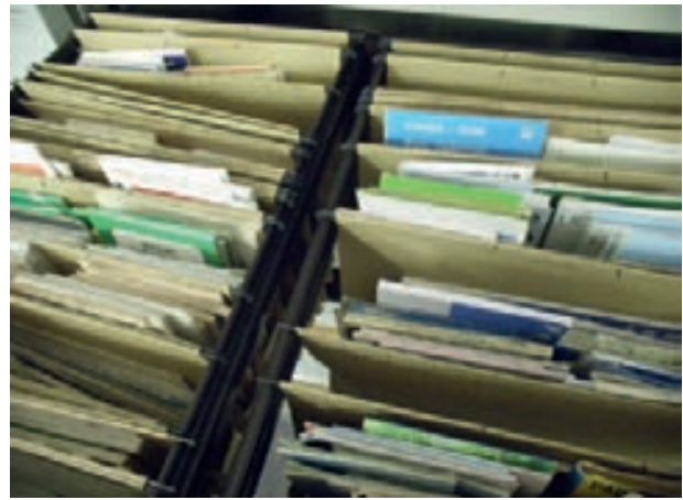
Handelsware, ungeordnet: Stadtpläne

Aber auch in den nichttechnischen Ämtern wird mit Karten und Plänen gearbeitet, allerdings meist nur punktuell. Hier einige Beispiele: In den Hauptämtern werden Karten der „Einteilung der Wahlgebiete in Wahlbezirke“ geführt, ferner finden sich in den Registraturen umfangreiche Planungsunterlagen zur kommunalen Neugliederung. In den Ordnungsämtern stößt man auf Karten zur Einteilung von Schiedsmanns- oder Jagdbezirken (bei letzteren ist sogar ein ausgesprochen ‚konservativer Umgang‘ zu beobachten, bei der Jagdbehörde des Kreises wird dem Vernehmen